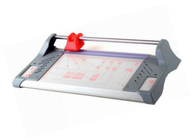
Dimensiones 320 (An x Pr x Al) 505 x 200 x 70 mm Peso 1.6 Kg

Cizalla de rodillo con base de construcción metálica con margenes en platico reforzado. Cabezal de corte de seguridad ergonómico con cuchilla de acero endurecido. Pisón de sujeción transparente y automático. Pintura en polvo anti arañazos. Escuadra extensible con escala en milímetros y pulgadas. Transportador con indicaciones de alineación en la barra de sujeción y en la tabla de corte para cortes angulares precisos. Regla en cm y pulgadas de medida en la mesa de corte. Construcción sólida y resistente a golpes. Ancho de corte A3. Capacidad de corte 11 / 10 hojas.