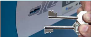
KIT CERRADURA DOBLE INTERVENCIÓN "E" TWO KEYS CONTROL KIT "E" KIT SERRURE À DOUBLE INTERVENTION "E"