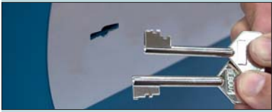
KIT CERRADURA DOBLE INTERVENCIÓN "L" TWO KEYS CONTROL KIT "L" KIT SERRURE À DOUBLE INTERVENTION "L"