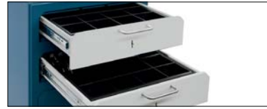
CAJÓN SUPERIOR UPPER DRAWER TIROIR SUPÉRIEUR