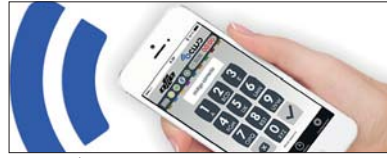
CONEXIÓN MEDIANTE SMARTPHONE SMARTPHONE CONNECTION CONNEXION PAR SMARTPHONE

Il s'agit de la solution idéale pour éviter les effractions dans les établissements de vente au public. Cette série dispose d'un tiroir avec des rails coulissants ; la partie avant présente un compartiment pour le tri des billets/monnaies et la partie arrière, un système basculant pour l'évacuation de l'argent à l'intérieur du coffre-fort au moment de la fermeture du tiroir.