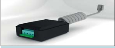
KIT INTERFACE ALARMA ALARM INTERFACE KIT KIT INTERFACE ALARME